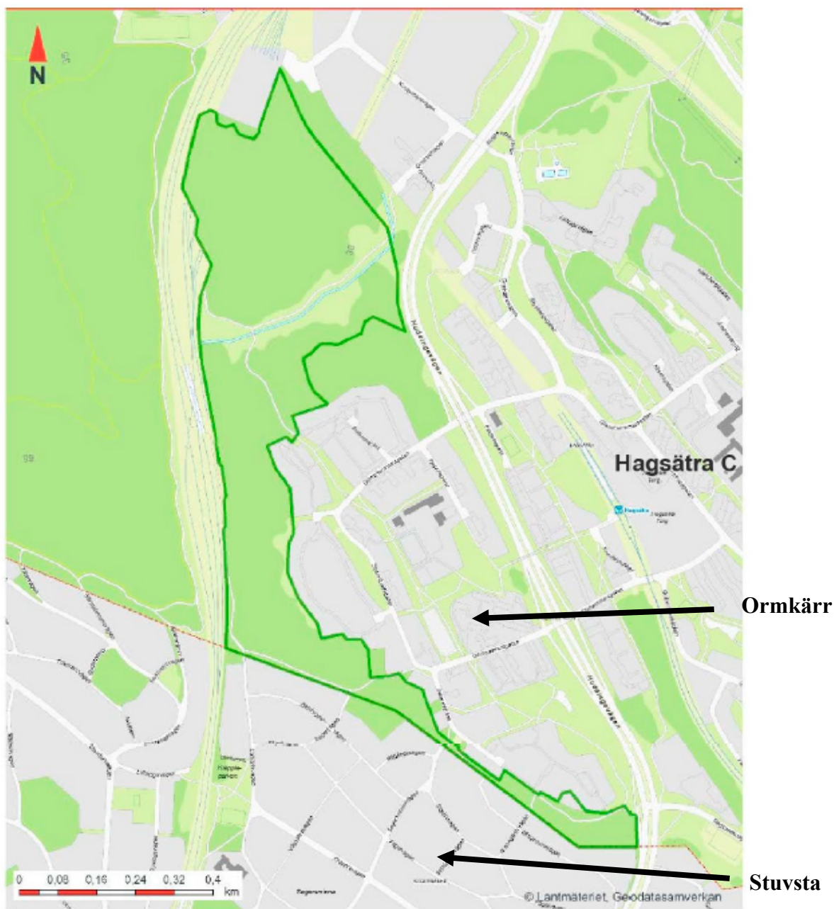
Figur 1. Föreslagen reservatsgräns markerad med grön linje.

Områdets värden och reservatsföreskrifter framgår närmare av bifogat beslutsdokument, beslutskarta och skötselföreskrifter, se bilaga 3.